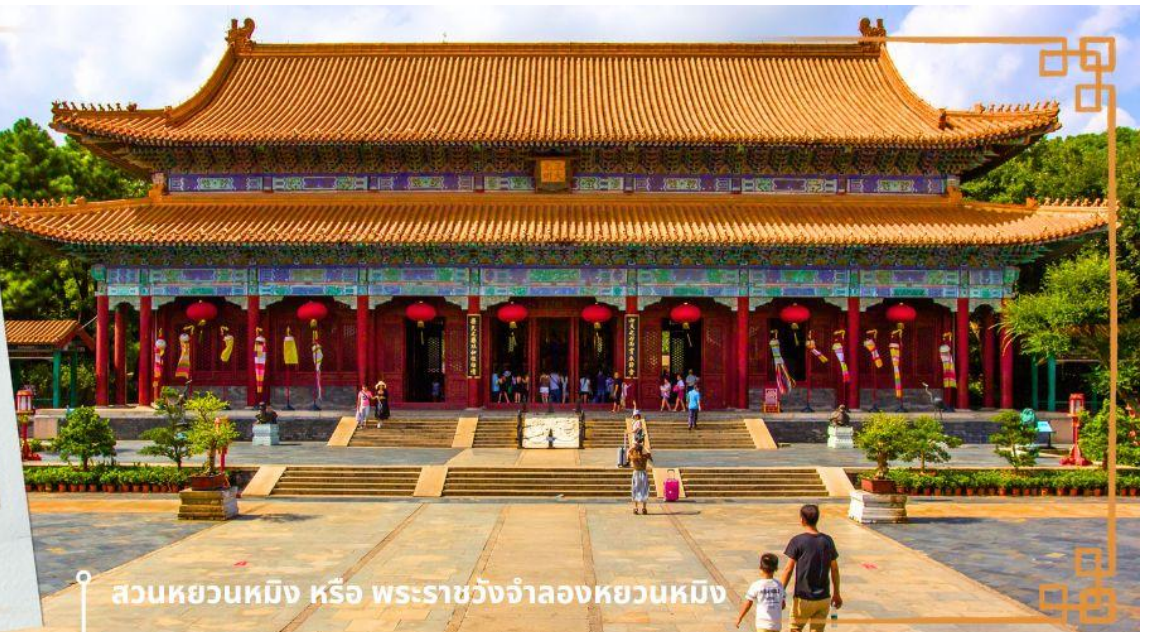
สวนหยวนหมิง หรือ พระราชวังจำลองหยวนหมิง