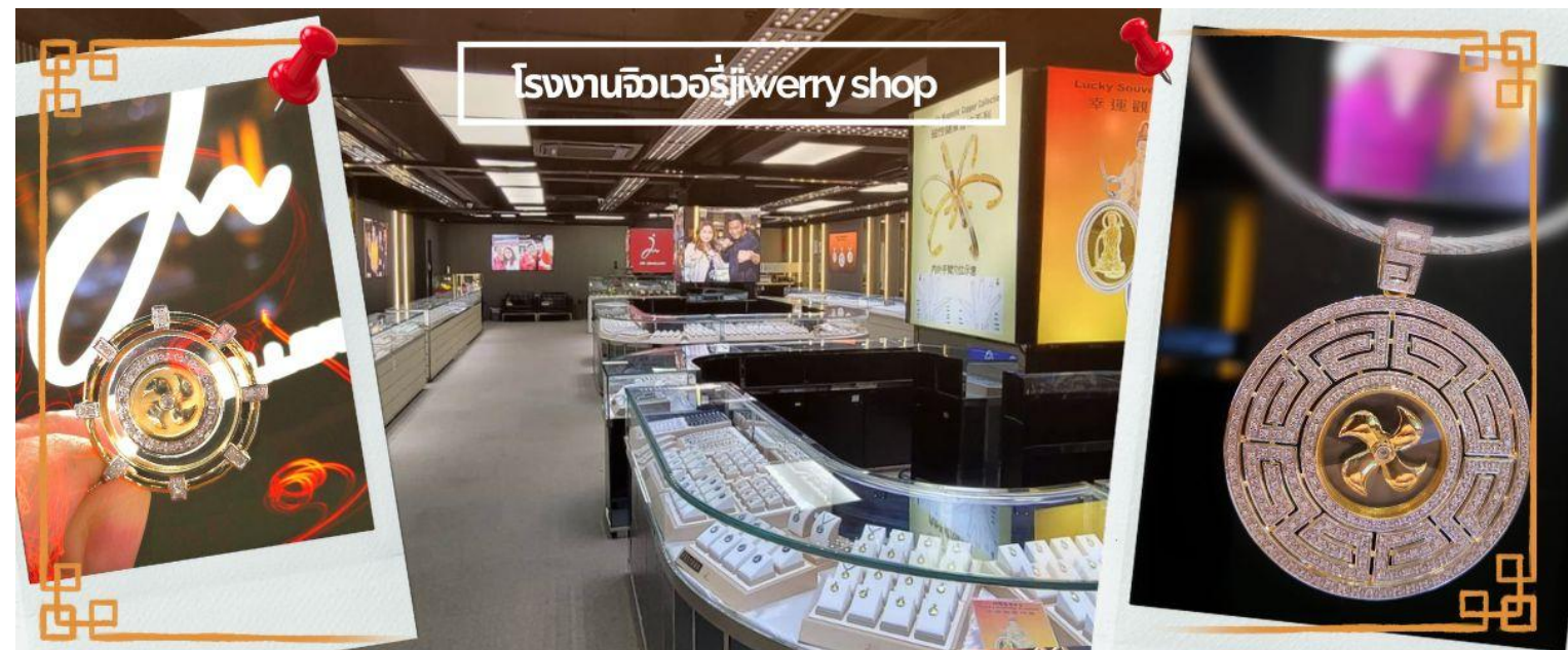
โรงงานจิวเวอรี่jewery shop

จากนั้นนำท่านชม โรงงานจิวเวอรี่ ซึ่งเป็นโรงงานที่มีชื่อเสียงที่สุดของฮ่องกงในเรื่องการออกแบบเครื่องประดับ อาทิเช่น จี้ และแหวนกำหัตน ที่สวยงามโดดเด่นไม่เหมือนใคร ซึ่งถือกำเนิดขึ้นที่นี่และมีชื่อเสียงที่สุดใช้เป็นเครื่องประดับติดตัว และเสริมดวงชะตา สินค้าทุกชิ้นมีเอกสารรับประกันคุณภาพเปลี่ยน ซ่อม ได้ตลอดอายุการใช้งาน หากเกิดการชำรุดจากสินค้าไม่ใช่ข้อบกพร่อง