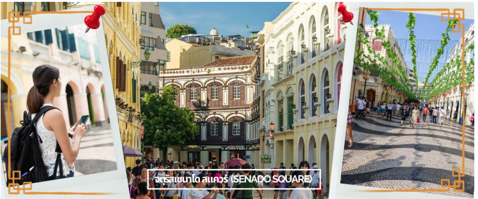
จัตุรัสเซนาโด สแควร์ (SENADO SQUARE)