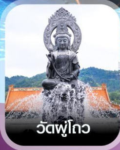
วัดฟูโถว